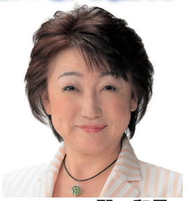
衆議院議員 郡 和子