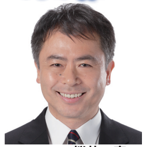
参議院議員 桜井 充 (仙台一高同級生)